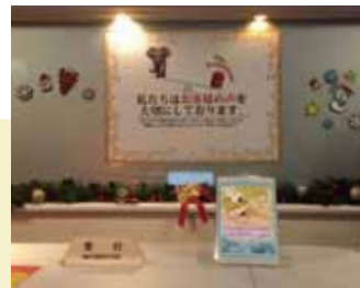
フロントに設置し、外国人旅行者の取り込みに力を入れている

ンターにつながる簡単操作。次の瞬間には通訳の顔が画面に映し出され、映像と音声をとおしてフェイス・トゥ・フェイスで直接会話ができる。iPadを手にしたホテルスタッフと通訳、利用客との3者での会話もスムーズに行なえる。