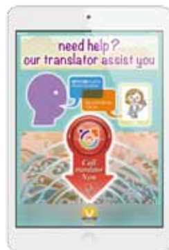
英語による案内を表示した TOP画面

通訳と利用客、ホテルスタッフが、高精細の映像と音声でフェイス・トゥ・フェイスでつながり、リアルタイム通訳が可能